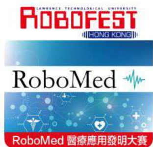
RoboMed 醫療應用發明大賽