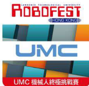
UMC 機械人終極挑戰賽